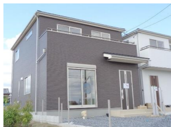
陽当たりが良い南側道路の立地