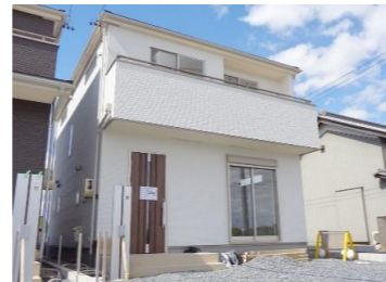
不動産価値のある東南の角地